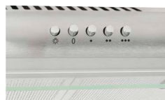
Bedienblende ohne Uhr Übersichtliche Bedienelemente